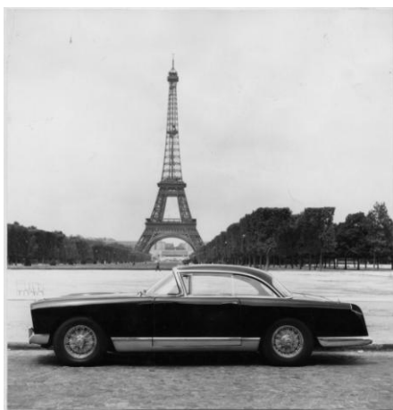
Facel Véga HK 500*