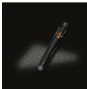
Amortisseur KONI Classic